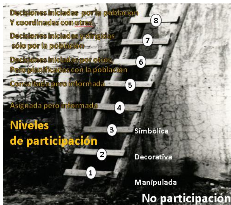
Ilustración 3. Escalera de la Participación de Rogert Hart [59]